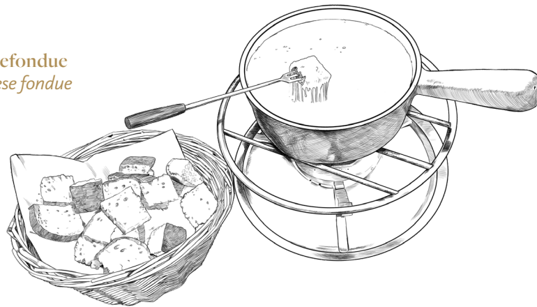
Käsefondue Cheese fondue