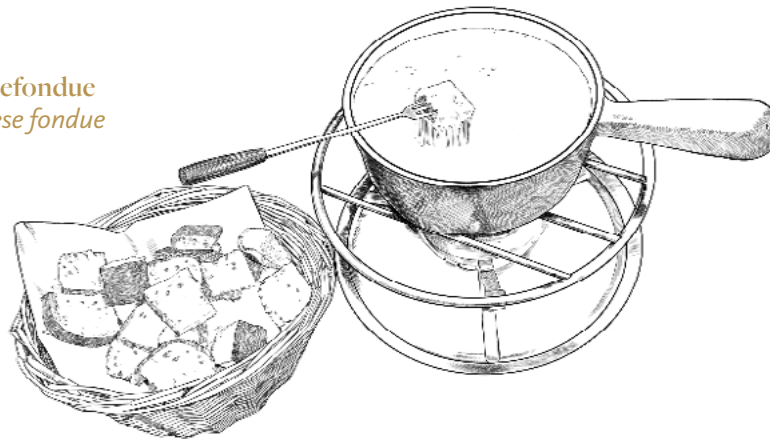
Käsefondue Cheese fondue